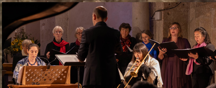
Maubourguet 2023 Concert Monteverdi