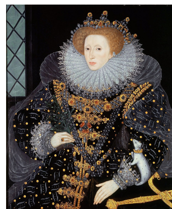
Elisabeth I ère

Cette musique n'est pas bien connue et nous voulons partager notre intérêt et notre enthousiasme avec le public.