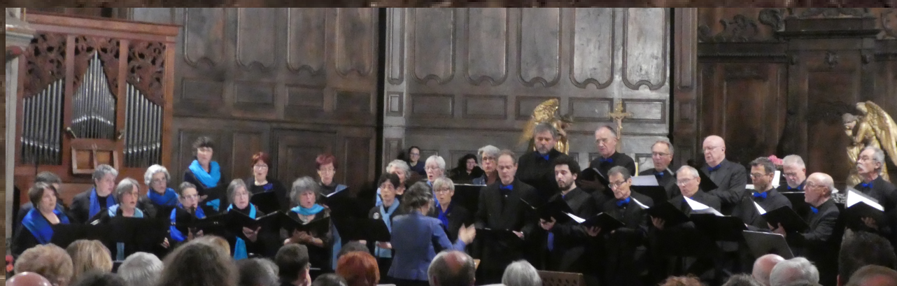
Ibos 2017 – Concert « Magnificats »