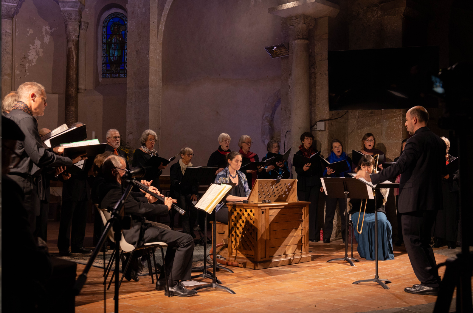
L'Ensemble Vocal de Bigorre accompagné par Turba Consort lors d'un concert « Monteverdi » à Maubourguet en 2023