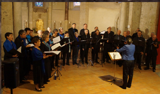
Maubourguet 2015 concert « Agnus Dei »