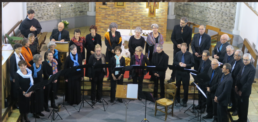
Tarbes – Saint Antoine 2015 – Concert « Agnus Dei ».